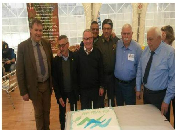
Conferenza delle Guardie Ittiche Ambientali del Piemonte e della Liguria, Casale Monferrato 2016