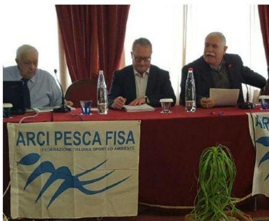
Progetto "La Rete dei Pescatori", Messina 2016