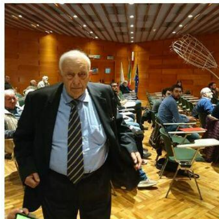
A Montecitorio durante una pausa di lavoro in occasione della presentazione del Progetto 'La pesca sportiva vettore di turismo'

Hai permesso all'Archi Pesca Fisa di poter fare negli ultimi anni quel salto di qualità in fase di progettazione, fino ad arrivare a toccare l'Europa, con una grande strategia di ampliamento delle opportunità concesse a livello internazionale.